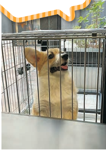
初出勤以来、大人気のナルトくん。