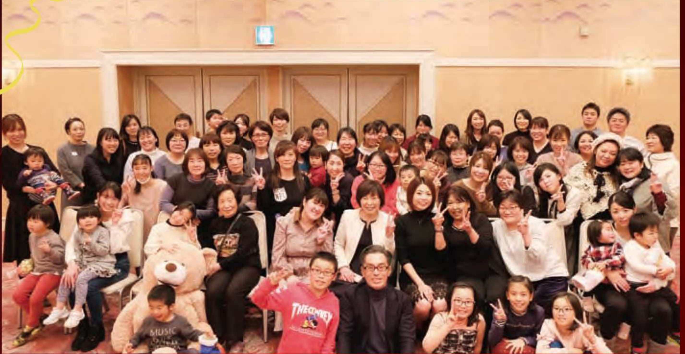
最後にみんな揃ってパチリ!

2019年 忘年会&職員表彰 (ホテルクラウンヒルズ武生) 毎年恒例の誠医会忘年会・職員表彰を行いました。理事長の講演からスタートし、職員も子ども達も食事とビンゴゲームで楽しみました。 その後今年一年の誠医会の取り組みと、来年の計画が発表されました。