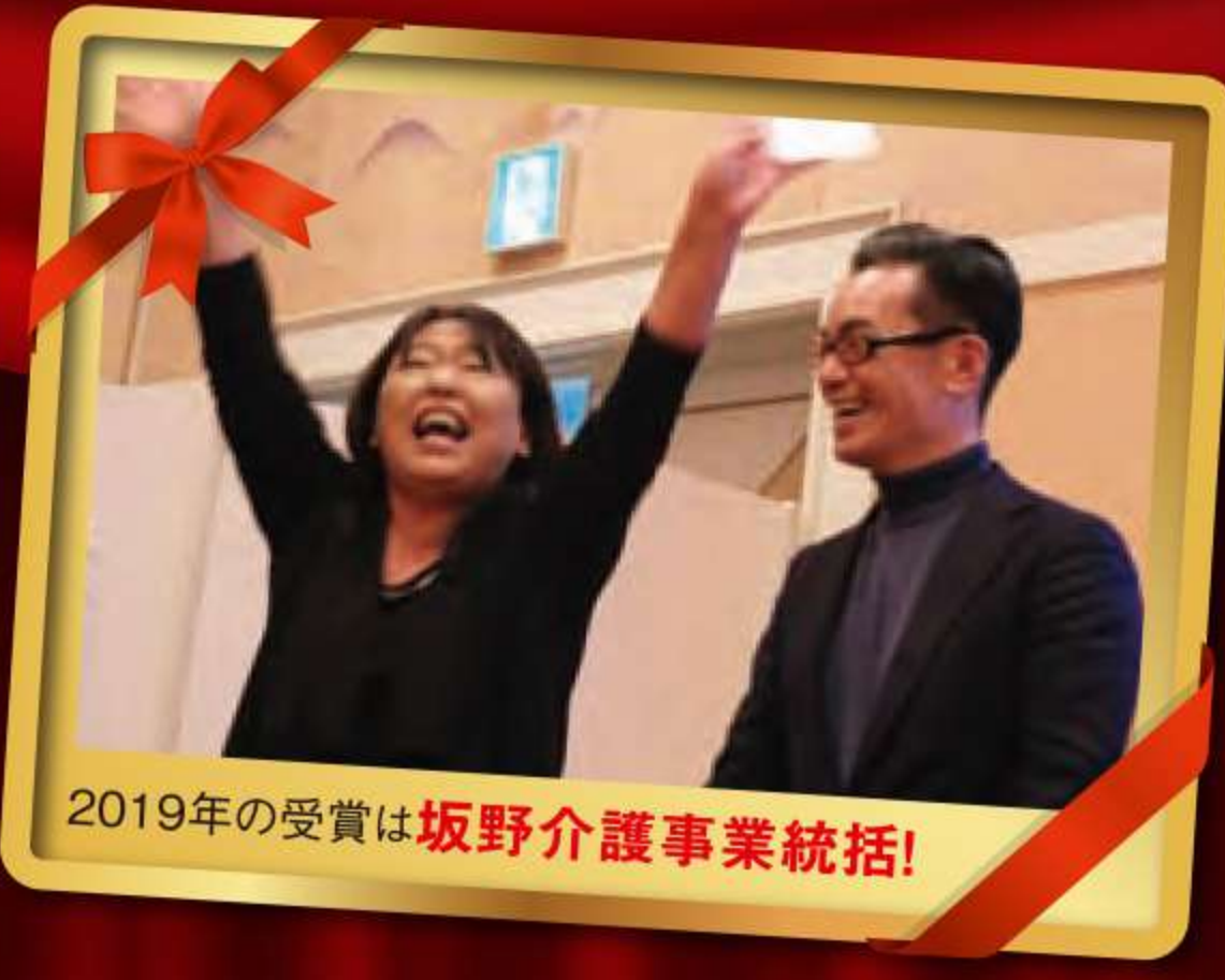
2019年の受賞は坂野介護事業統括!