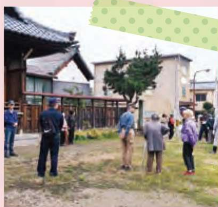
本多1丁目「御霊神社」に集合。

10月14日に合同防災 訓練を行いました。台風 19号の翌日ということも あり、日頃の備えが重要だ ということ、沢山の方に 参加していただきました。