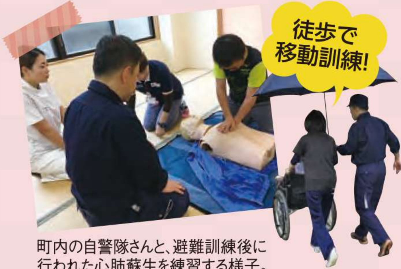
町内の自警隊さんと、避難訓練後に行われた心肺蘇生を練習する様子。

地域で病院を維持することが可能か、 また必要かどうかをよく議論して決 めていかなければなりません。今後、日 本は少子高齢化、人口減少社会を迎 えます。越前市でも2015年には 81524人の人口が2045年に 56254人と31%もの人口減少 が予想されています。更に、老々介護や 独居の方も増えています。このよう な変化が確実に予想される越前市にお いて国が勧める地域包括ケアシステム をどのように実現していくかが、大切 であると考えております。 医療と介護は、人々が安心して暮 らすために必要不可欠な社会インフ ラであると考えています。だからこそ、 持続可能であるかどうかをよく議論 検討して未来に投資していくことが、 次の世代に対する私たちの責任では ないでしょうか。今年も医療介護を通 じた地域づくりに取り組んでまいり ますので、よろしくお願いいたします。