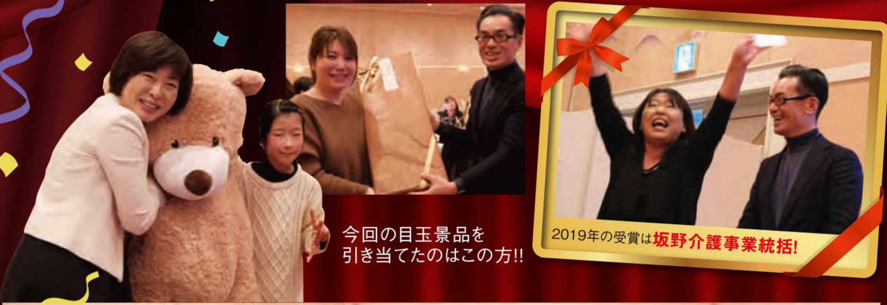
今回の目玉景品を引き当てたのはこの方!!