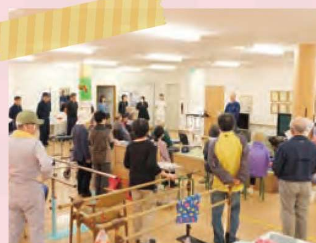
デイサービスアイの2階に避難。

まず本多一丁目の一次 避難場所である御霊神社 に集合しました。避難者の 確認後、御霊神社からデイ サービスアイまで徒歩で移 動訓練を行いました。本多 一丁目には、公民館等の公 的施設がありませんので、 緊急時には、デイサービスアイ を避難場所として利用する ことになっています。避難訓 練後に日本赤十字社の方よ り、救急蘇生法についての研 修を受け、町民の皆さんと防 災について話し合いました。